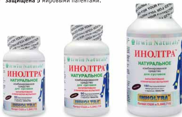
60, 90 и 180 капсул Quicksorb Gels™

Патент США № 5,840,715 Мировой патент № WO 9,721,434 Патент Канады CA 2,240,165 Европейский патент EP 855,908 Патент Австралии AU 9,726,327